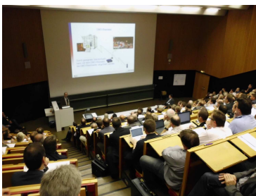
Blick in den Hörsaal der MHH