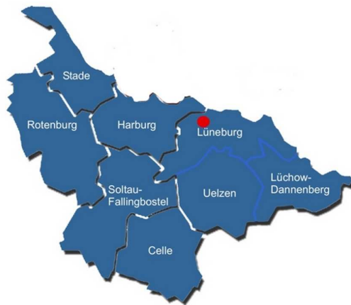
Polizeidirektion Lüneburg mit den Landkreisen

Die mit Digitalfunk versorgte Fläche beträgt in diesem Bereich weit über 9.000 km 2 . Damit hat Niedersachsen die bisher größte zusammenhängende Fläche der Bundesrepublik Deutschland in der digital gefunkt werden kann.