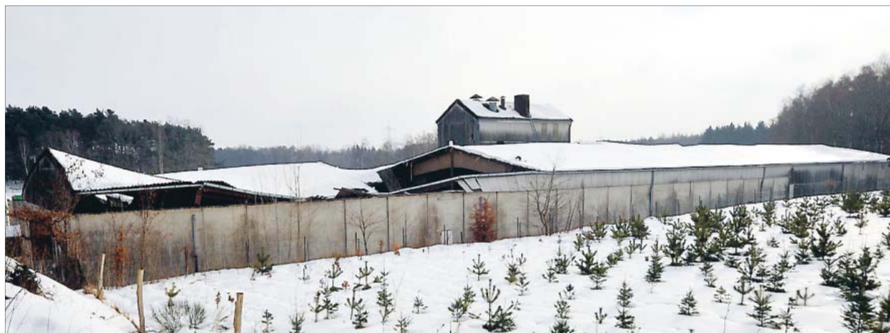
Ein Teil des Dachs der Raiffeisen-Halle in Embsen ist eingekracht, geschätzt bis zu 75 Kilo Schnee pro Quadratmeter liegen auf den Dachflächen.