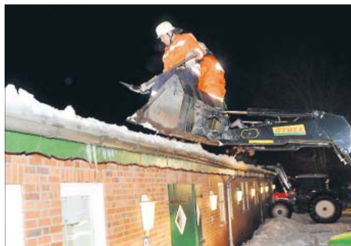
Unten: Aus den Schaufeln von Traktoren schippten Feuerwehrleute an der „Grünen Stute“ in Brietlingen Schnee vom Dach der Reithalle. Rund 40 Helfer waren stundenlang im kräftezehrenden Einsatz.